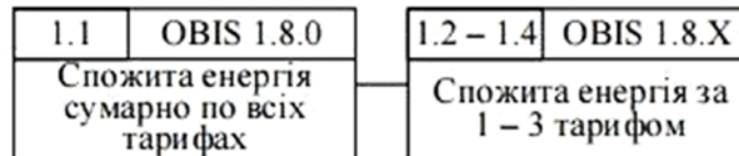
Рис. Дані, які вимірює та обчислює лічильник електроенергії.

Показники перегортаються в автоматичному режимі на дисплеї лічильника! Одночасно відображується поточний тариф за яким ведеться облік електроенергії (немигаючий індикатор) та тариф, покази якого відображаються в даний момент (мигаючий індикатор); при збігу поточного тарифу та відображуваного тарифу мигає лише один тариф.